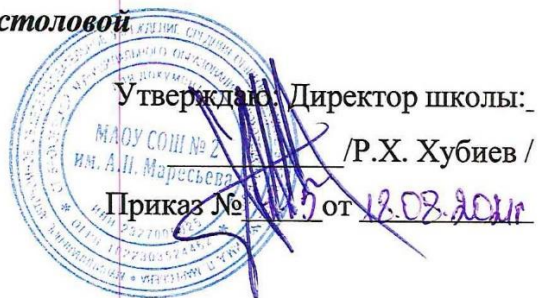
График приема пищи в школьной столовой